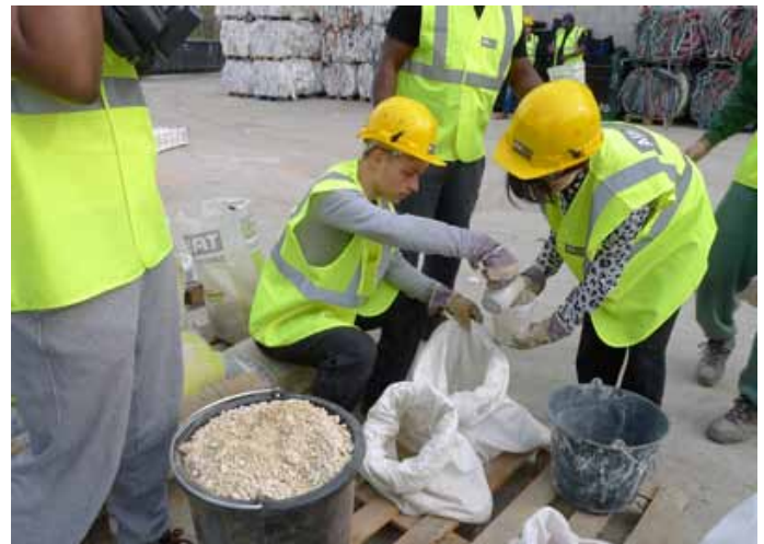
Prototype marbre d'ici / Cergy 2016 - 001