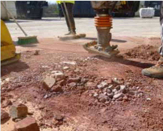
Prototype fraîchement décoffré