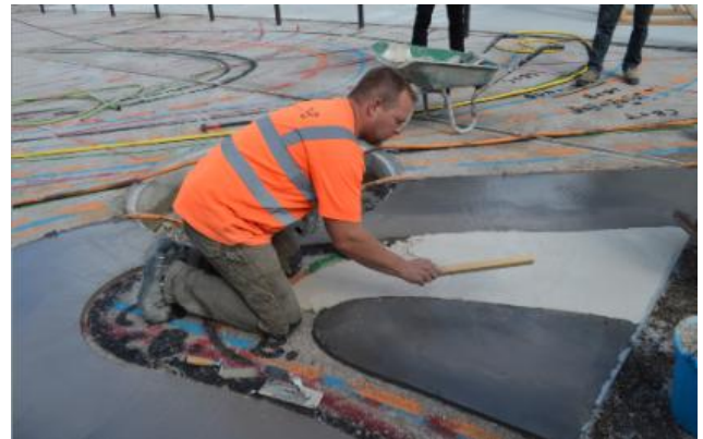
Le coulage du Marbre d'ici