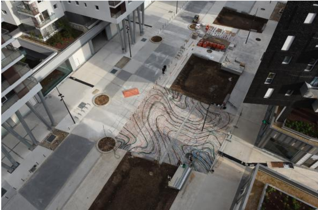
La vue aérienne du traçage