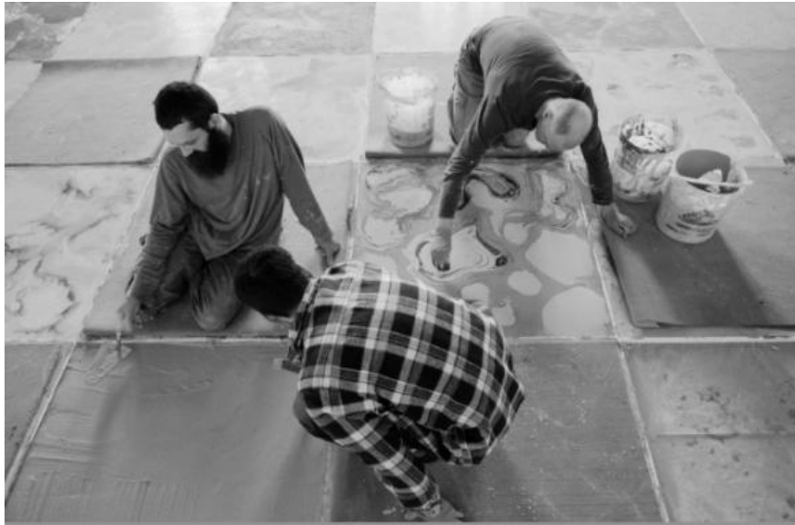
Dallage du Château de Chamarande

La mise au point des bétons et la réalisation sur site dans un contexte artistique avec l'ensemble de l'équipe de Stefan Shankland ont été une expérience très enrichissante, tant sur le plan technique qu'humain. »