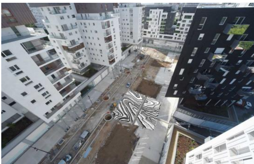
Marbre d'ici, place du Général de Gaulle, photomontage

Sur la place du Général de Gaulle, pour créer un nouvel espace public, Marbre d'ici prend la forme d'une grande dalle en béton de 260 m 2 qui est coulée du 21 au 25 septembre 2015. Cette sculpture dans l'espace public utilise plus de dix tonnes de briques, pierres calcaires et autres gravats provenant de la démolition des immeubles et entrepôts du quartier. Concassés et réduits en poudre, ces gravats sont intégrés à la composition d'un nouveau béton utilisé pour réaliser le sol de la place.